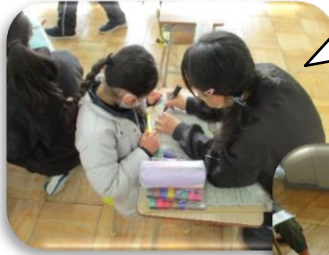
6年生とたこのしっぽを一緒にぬったよ。

また、16日(土)には、瑞徳公園内のレクリエーション広場で子ども会主催の「たこ揚げ大会」が行われました。今年は、1～3年生の部だけでしたが、たくさんの親子が参加しました。この行事は、長年弥富学区で引き継がれてきた行事で、地域の皆様もとても大切にしている行事です。学校で作ったたこで親子のふれあいができたことをうれしく思いました。