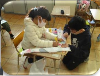
糸を結ぶのが難しかったけれど、お姉さんがギュッと結んでくれたよ。