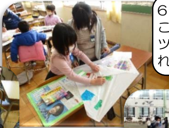
6年生が、たこをとばすコツを教えてくれたよ。