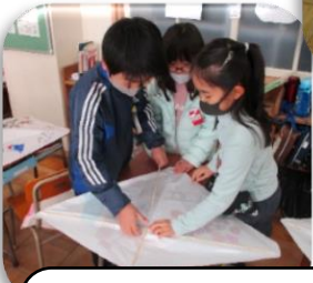
お姉さんたちがたこの作り方を教えてくれました。高く飛んだからよかったです。