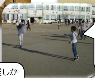
お兄さんが、たこを持っていてくれて、風が来たらはなしてくれたよ。だから、たこが高くあがったよ。