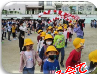
1年生を迎える会で 元気に挨拶できたよ