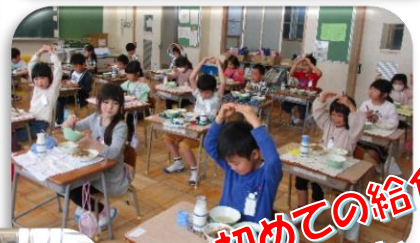
初めての給食 おいしかったよ