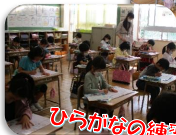
ひらがなの練習 集中しています!