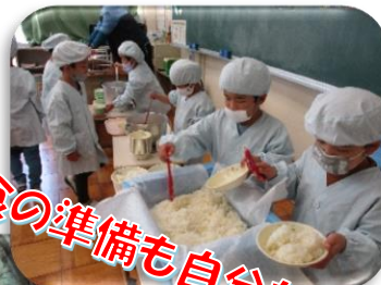
給食の準備も自分たちで