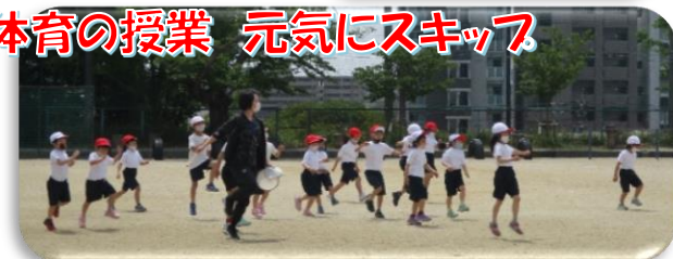
体育の授業 元気にスキップ