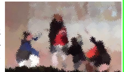
<5年 人間になりたがった猫>