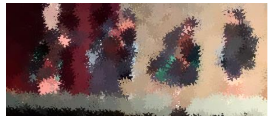
<1年 うたのきらいなおうさま>

先日は、学芸会にご来場いただきありがとうございました。 直前の練習を思うようにできない学年があったにもかかわらず、柳っ子は、素晴らしい力を発揮してくれました。保護者の皆様にも、当日に向けて、ご支援とご協力をいただき、大変感謝しております。本当にありがとうございました。