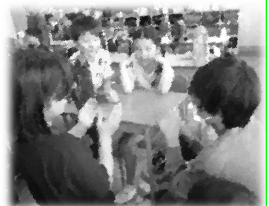
ゲームのやり方、教えてもらおうよ。

コロナ禍では人と交流することが制限されてきましたが、人のかかわりから学ぶ場も大切にしていきたいと考えています。