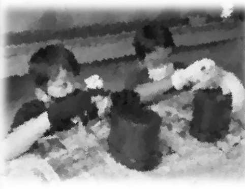
うまく炊けたかな♪