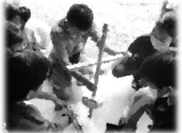
火起こし体験！うまく火がつかない・・・