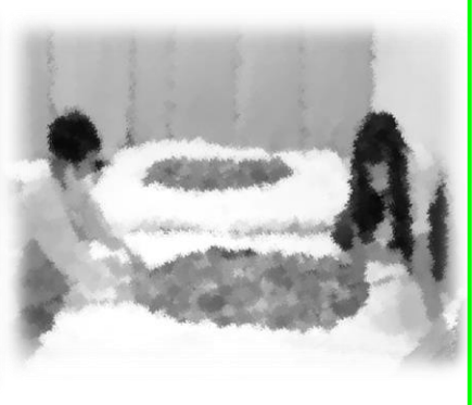
布団も自分たちで準備しました