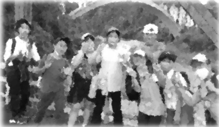
知原橋までハイキング！汗だくでした！