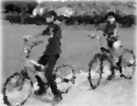
モトクロス楽しかったよ！