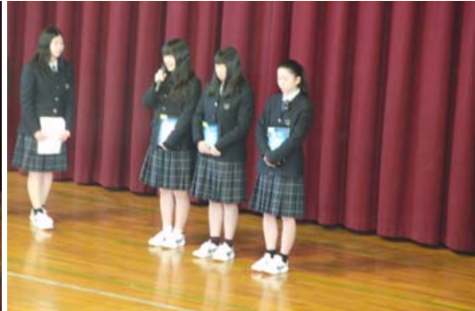
サイバー犯罪防止講話 平成31年3月6日(水) NTT Docomo 株式会社より講師を招き、1・2年生を対象にサイバー犯罪防止講話を行いました。