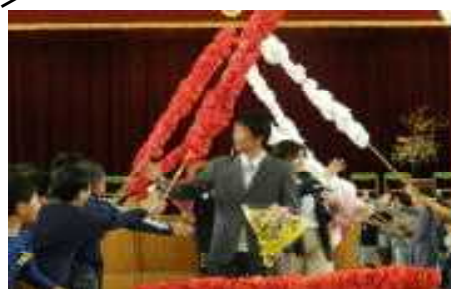
<名残惜しいですがお別れです>