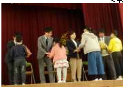
<感謝の気持ちを込めて花束贈呈>