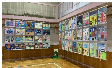
《5年 心に残ったあの時 あの場所》