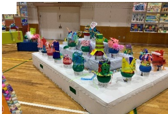
《2年 わっかて へんしん》