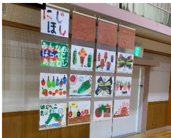
《にじ・ほし はらぺこあおむし》