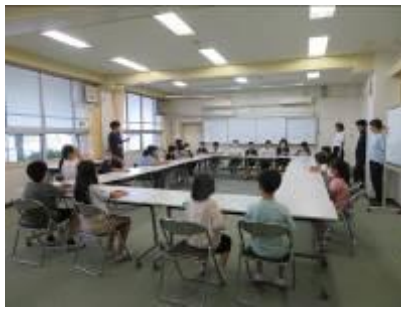
【ING スローガンを話し合う様子】