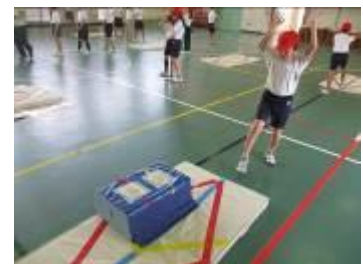
【側転を練習する様子】

児童は、成功させたい技や上手にできなかった運動に目を向け、自分なりの目標を決めています。10月に行ったマット運動の授業では、4年生は、側転(側方倒立回転)を成功させるために、様々な手立てを活用して、練習に取り組みました。5年生は、録画した自分の姿と、技の見本動画と比べながら、課題を見付け、練習に生かしていました。今後も、子どもたちが自ら考え、目的意識をもって学習に取り組めるように工夫を重ねていきます。