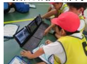
【動きを確認する様子】