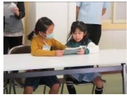
【各学級の意見を伝え合う様子】