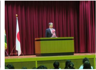
【実行委員長の挨拶】

第1部は、校長先生や実行委員長の挨拶の後、浮野小学校50年の歴史を写真と当時の音楽とともに振り返りました。卒業アルバムや、事前アンケートで寄せられたエピソードを中心に、参加者一人一人が大切な思い出を振り返ることができました。