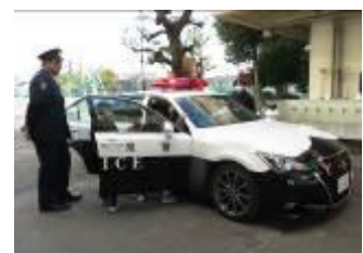
【パトカー乗車体験】