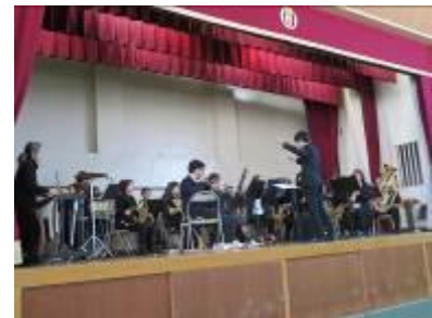
【浮野小50周年記念ウインドオーケストラの演奏の様子】