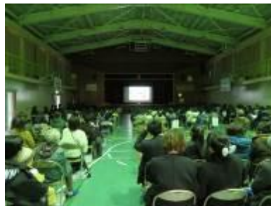
【50年を振り返るスライドショーを見る様子】