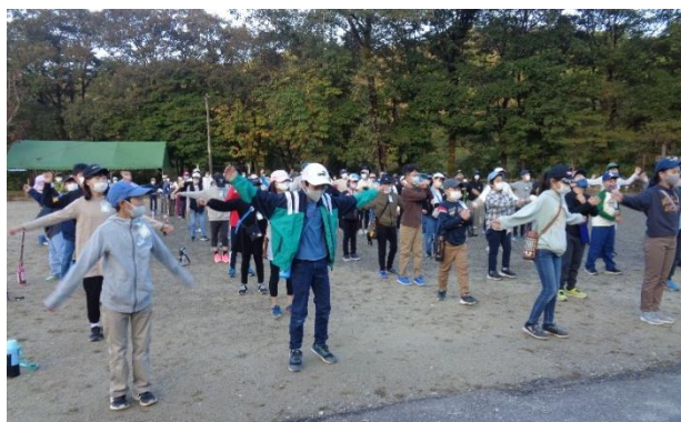
朝の集い ラジオ体操