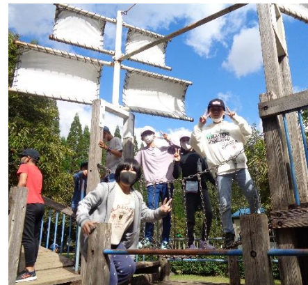
フィールドアスレチック