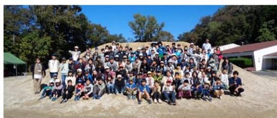
おむすび山で集合写真