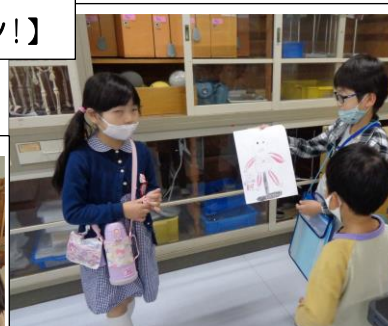
【筋肉の模型があるよ】