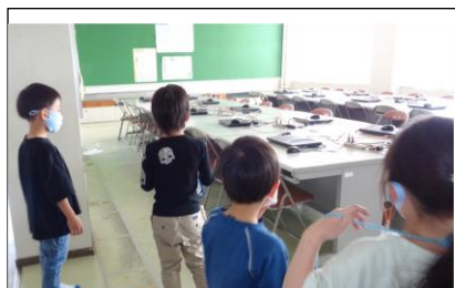
【コンピューター、何台あるかな】