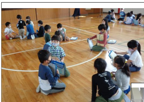
【自己紹介をしました】