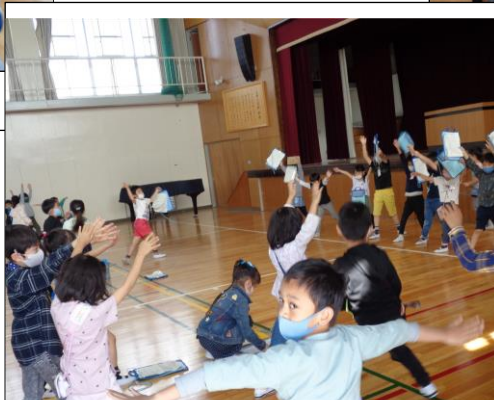
【♪グループじゃんけん、 じゃんけんポン!】