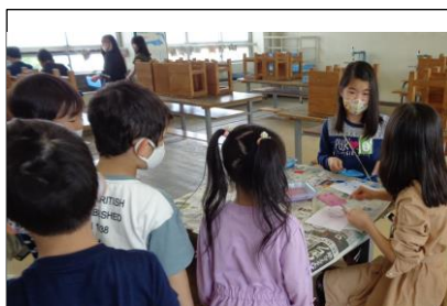
【高学年の図工、すごいね】