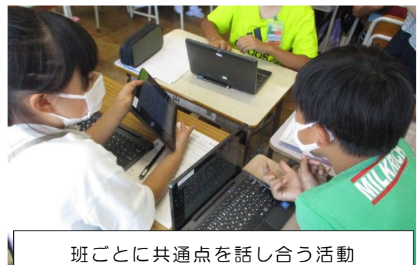
班ごとに共通点を話し合う活動