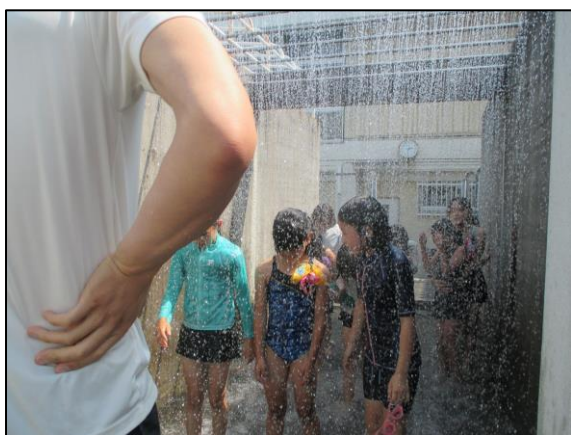
[シャワーは、やっぱり冷たい]

友達との距離を取ったり、静かにシャワーを浴びたり、新型コロナウイルス感染症の予防策を取りながら、頑張っ課題に取り組む子どもたちは、とても立派だと思います。最後には、着衣泳を行う予定です。後日、プリントでお知らせします。