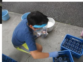
【残った牛乳を片づける様子】