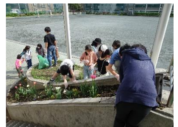
【花壇をきれいに整える様子】

4月12日(火)から委員会の活動が始まりました。休み時間に放送を掛けたり、初めての仕事に一生懸命取り組んだり、5年生のみんなはやる気いっぱいです！子どもたちからは、「緊張したけど楽しい！」「学校みんなのために、高学年の人たちがこんなに仕事をしていてくれたんだね。」という声が聞かれました。高学年として、これからも頑張っていってほしいと思います。