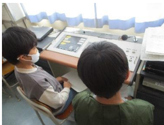
【お昼の放送の様子】