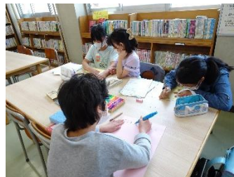
【図書の資料を作る様子】