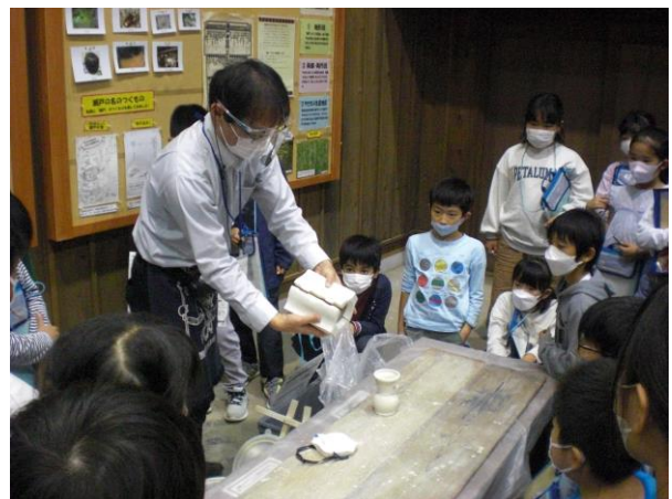
【型を作ることで多くの焼き物が 作れるようになりました】