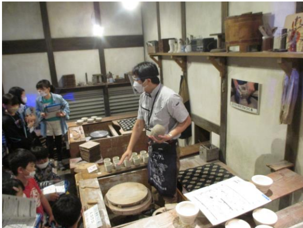
【ろくろで形を整えます】

品野陶磁器センターでは、手びねり体験をしました。子どもたちは、自分のアイデアに近づけようと真剣に取り組んでいました。また、焼き物を作る苦労を実際に体験することで、職人さんのすごさを感じ取ることができました。