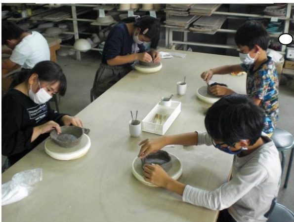
【焼き物作りに挑戦！】