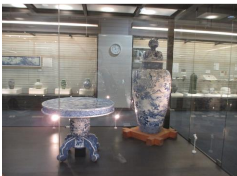
【これぞ職人さんの技！】