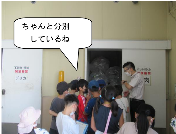
【ごみ倉庫の中を見せてもらいました】

9月30日（金）に、社会科「はたらく人とわたしたちの暮らし」の学習で、学区の FEEL RISE 植田店へ行きました。子どもたちは、普段は入ることのできないバックヤードを見学し、商品の保管の仕方や、新鮮さを保つための工夫を学ぶことができました。その他にも、店内の写真を見たり、店長さんへ質問をしたりすることで、買い物に来たお客さんに喜んでもらうための様々な工夫と努力に気付くことができました。