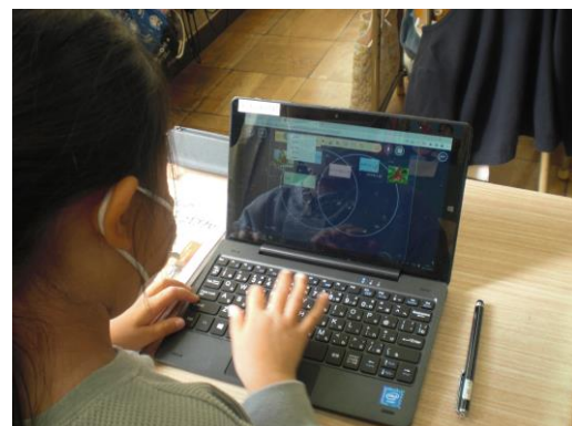
【思考ツールの活用】

2つの植物の育ち方の似ているところや違うところに目を向け、ベン図にまとめました。