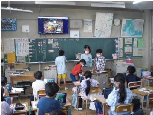
【ロイロノートの活用】

理科では、4月からヒマワリとホウセンカを育ててきました。今ではヒマワリは枯れ、ホウセンカは跡形もなくなってしまいました。そこで、これまで撮りためてきた写真を使って成長を振り返り、その変化をまとめる活動を行いました。グループのみんなで協力してまとめた後、発表をしました。発表を聞きながら、2つの植物を比較することで、植物の成長にはきまりがあることを発見することができました。