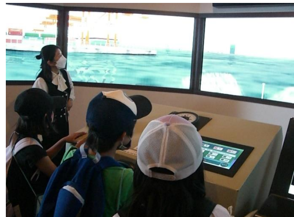
[ シミュレーターで船を操縦しました！ ]