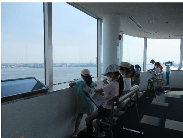
[ 展望室から名古屋港を見渡しました！ ]

名古屋港では、1学期に社会科「市の様子」で学習した名古屋港の様子について学びを深めることができました。ポートタワーの展望室から名古屋港を見渡して、発電所や大きな工場、倉庫がたくさんあることを確かめました。