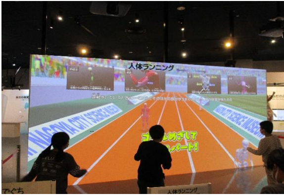
<だれが、一番になるかな>

プラネタリウムでは、月の観察の仕方や冬の星座について子どもたちに分かりやすく説明していただきました。その後、館内をグループで回りました。友達同士で楽しくいろいろ体験をしながら、科学を学ぶことができました。