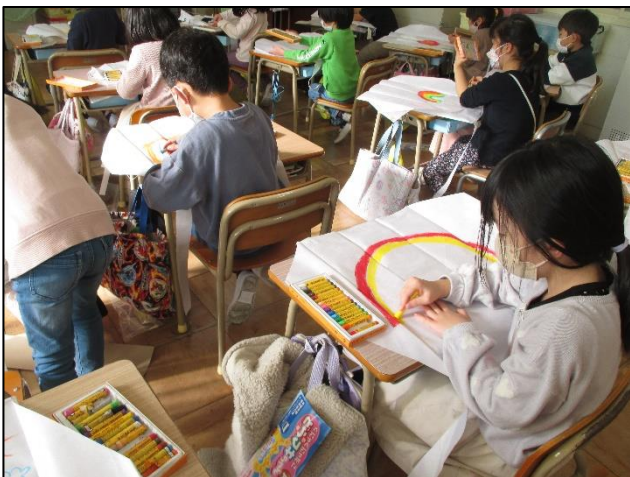
【どんなたこにしようかな】