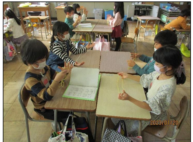
【あやとり、じょうずにできるかな】