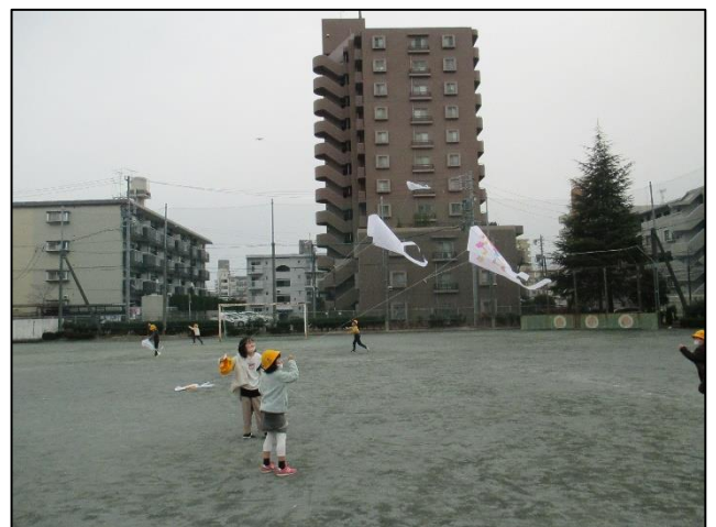
【たこが高くあがってうれしいな】