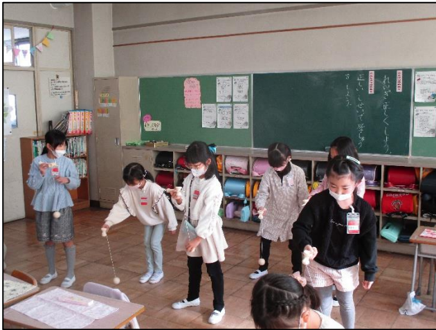
【けん玉難しいけど、頑張るよ】

生活科「いろいろ あるね にほんのあそび」の学習で、たこあげ、こままわし、けん玉、お手玉、あやとりなどに取り組んでいます。友達どうし教え合いながら、むかしあそびの練習をしています。初めてこまを回すことができたり、けんだまの技が成功したりしたときには、「できた！」とうれしそうに先生や友達に伝える姿も見られます。