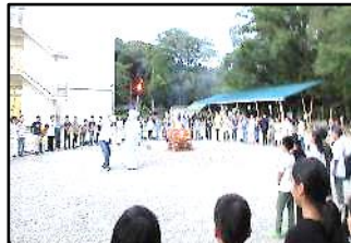
【キャンプファイヤー】