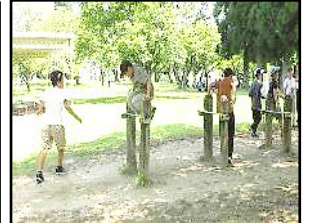
【フィールドアスレチック】