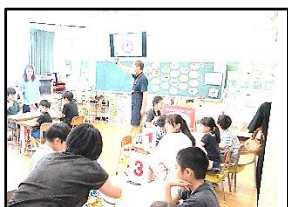
【つつい 総合的な学習】

7月3日(水)、授業参観を実施しました。どの学年も心身ともに成長した姿を見てもらうことができたいと思います。蒸し暑い中、多くの保護者の方にご参観いただき、ありがとうございました。