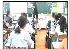
【自分にできることは…】

6月11日(火)、6年生において、愛知県弁護士会に所属する弁護士の方をお招きして、いじめ予防出張授業を行いました。過去に実際に起きたいじめの事案を通じて、いじめが重大な人権侵害行為であることを子どもたちに知ってもらい、いじめられた側だけでなく、いじめた側、周りの子どもたちにも残る心の傷について学習する内容でした。いじめを予防するために、自分に何ができるのかを考える貴重な機会となりました。