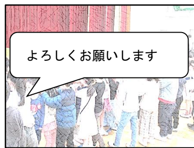
【前年度の代表委員による司会・企画】