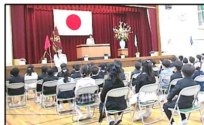
【担任の先生と挨拶】

4月7日（月）、入学式を行いました。天候に恵まれ、1年生は瞳をきらきらと輝かせて、登校していました。希望に胸を膨らませて、計〇名の1年生が筒井小学校に入学しました。早く小学校に慣れて、楽しい生活を送ってほしいと思います。