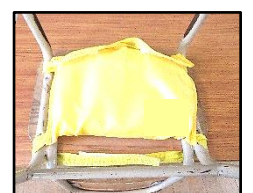
【椅子に取り付けた 防災ヘルメット】

校長からは、まず頭を守ることが大切であること、非常時に学校に避難した場合に使用可能な運動場南側に設置された防災かまど(名古屋市立工芸高等学校の生徒さん製作)の話をしました。また、今年度より机の下に潜る低い姿勢のまま防災ヘルメットを取り出しやすくするため、椅子への付け方を統一しました。非常時に自分の身を守る行動ができるよう、日頃から備える大切さを子どもたちに指導していきたいと思います。