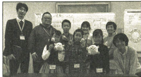
とうじつ インタビューにさんかしてくれたみなさん

かわくちいいん 【川口委員からひとこと】 きょういくがく けんきゅう がくしゅうしえん けいけん い 教育学の研究や学習支援の経験を活かしながら、 こ どもたち こま よ そ こ 子どもの権利を まも 守っていきますので、これからよろしくお願ひします。