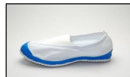
(写真2) 体育館シューズ