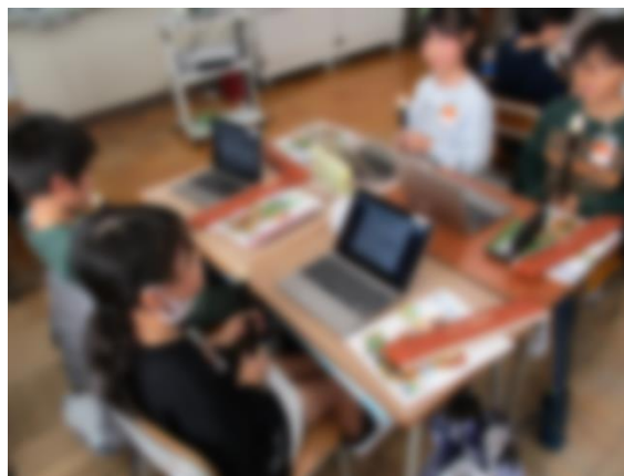
友だちと旋律をつなげて練習している様子