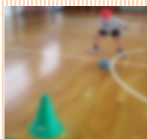
【的を狙ってボールを転がす様子】