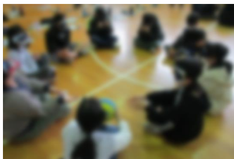
アイマスクを着けてボールを隣の人へ送っている様子

今後も、全ての人暮らしやすい社会を実現するため、一人一人が福祉に対する理解を深め、相手の立場や状況を考えて行動する「思いやりの心」を育ててほしいです。