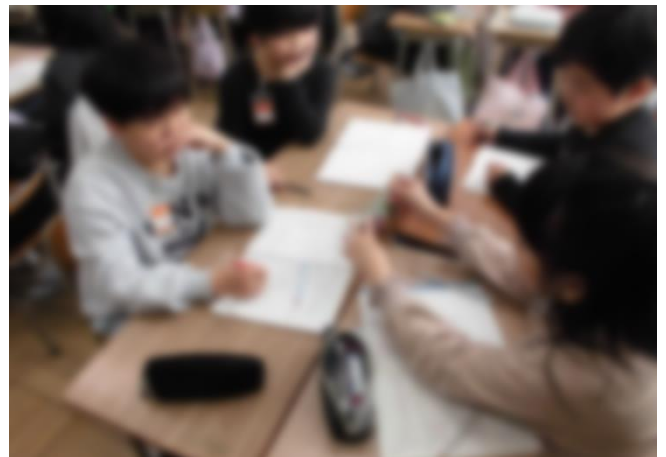
4-2 「面や辺の平行と垂