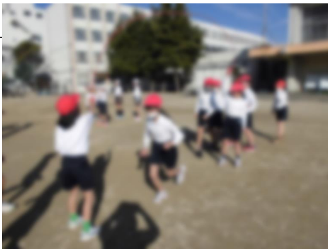
【大きな声で跳んだ数を数える様子】