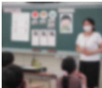
絵パネルを使って説明する栄養教諭

1年生やわかば学級では、楽しく食事をするための約束や給食に関する秘密などを絵本やイラストを使ってお話しされました。4年生では、よくかんで食べることの大切さについて、クイズを交えながら理解させることができました。食に関する指導は、2学期以降も学年に合わせたテーマで、各学級1時間ずつ行っていく予定です。