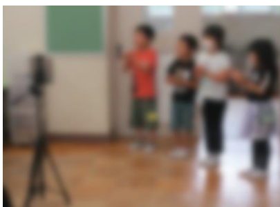
グループで考えたリズムを発表する様子