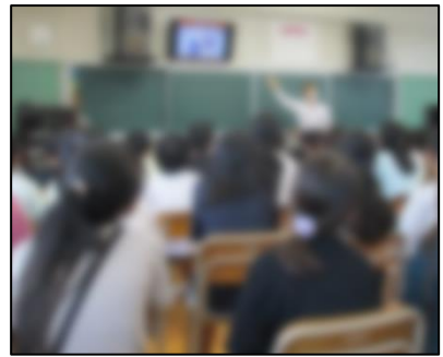
アニメーションを使って説明する講師

参加した児童は、「おうちでルールを決めて、守れるようにしたい」などと、感想を話していました。ぜひ、ご家庭でも、夏休みに向けてスマホやインターネットの使い方について、話し合ってみてください。