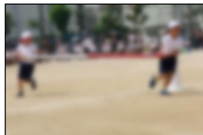
3年 玉川ハリケーン