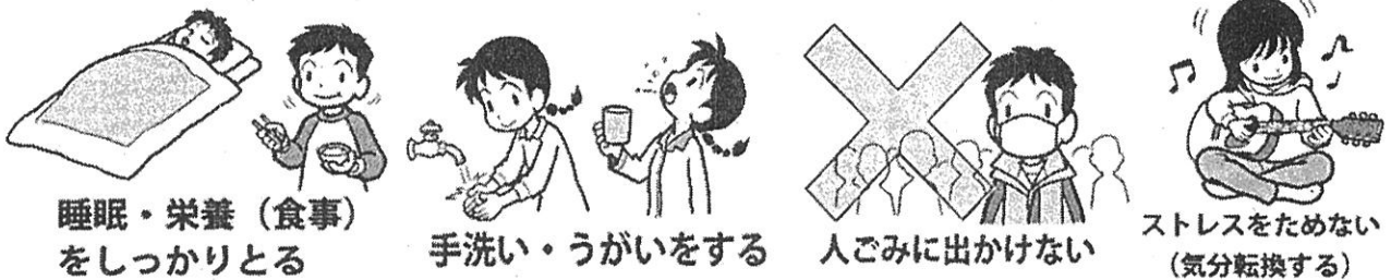
睡眠・栄養（食事） をしっかりとる

規則正しい生活で基礎体力や免疫力を保ち、感染拡大防止のために行動しましょう。 ひとりひとりの心掛けが感染予防には大切です。滝ノ水中の健康をみんなで守りましょう。