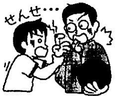
先生にことわってから来る