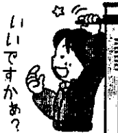
備品等に勝手に触らない