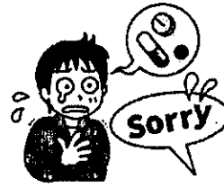
内服薬は出せません