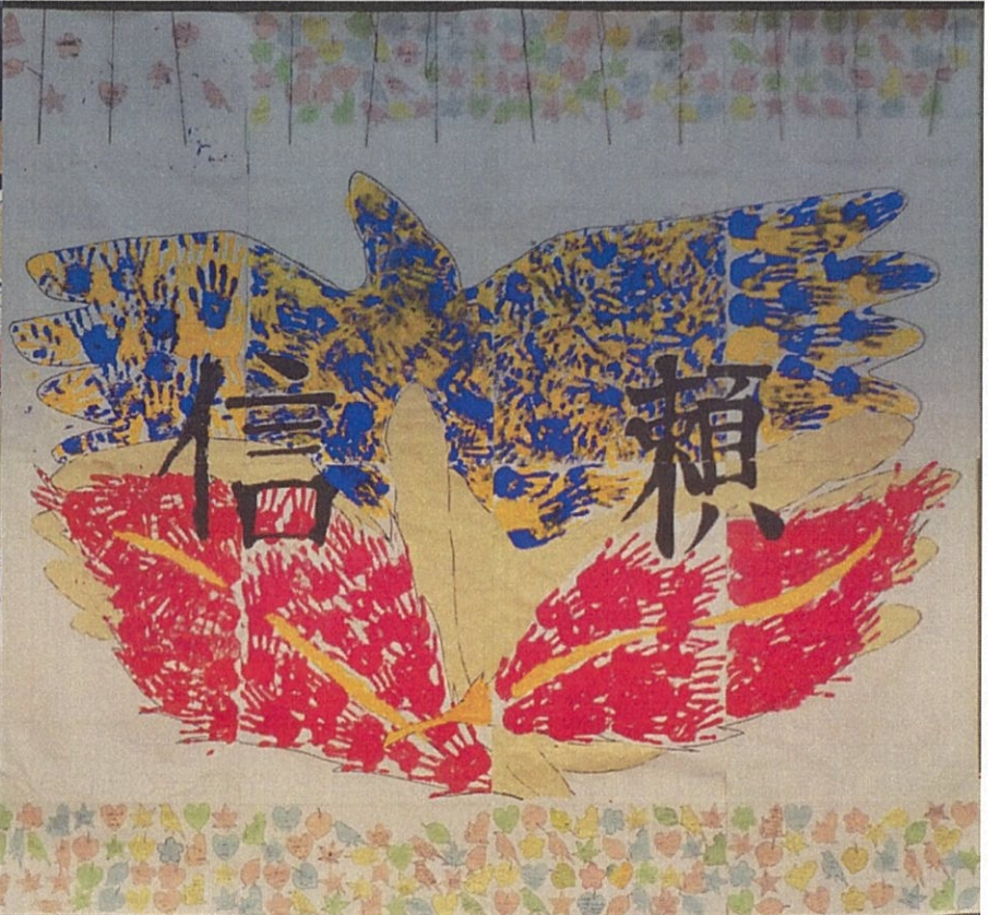
みんなの手形とメッセージ