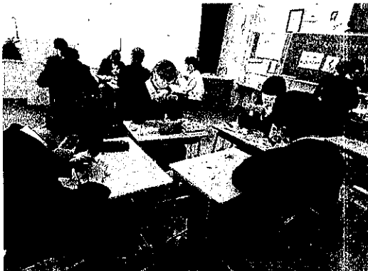
〔花文字の花づくりの様子〕

2月25日 (金) の2・3時間目に3年生を送る会が行われました。今年度もコロナ対策として3密を避けるため、3年生は体育館で、1・2年生は中継を教室のテレビモニターで見ながら参加しました。舞台発表の生徒たちによる「3年間の思い出の演劇」は事前にビデオを撮影し、それを体育館で上映しました。また、会場装飾実行委員が中心となり、1年生全員で作った花文字を、代表生徒が3年生に披露し、大きな拍手をもらいました。例年と違う形ではありましたが、3年生へ感謝の気持ちを伝えることができ、これからは自分たちが先輩として頑張る番だと実感できる、思い出深い行事となりました。