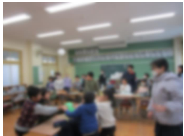
【風船が二個に増えました】