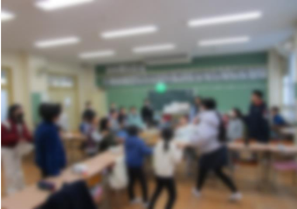
【風船をとにかくコートから出そう】

フレンドリータイムも回数を重ねるにつれて、1年生と6年生が打ち解けてきました。風船バレーでは、白熱したゲームになりました。班ごとのトランプ大会では、穏やかにゲームができました。どのクラスもそれぞれゲームの特性を生かして、楽しい時間を過ごすことができました。