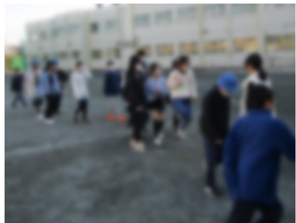
【目標回数を目指そう】