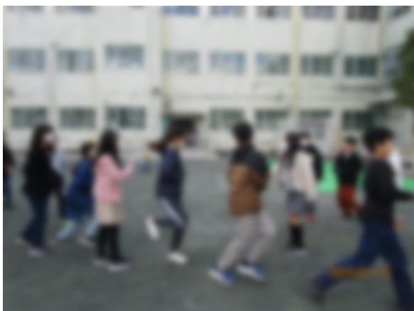
【リズムを崩さないように】

最後の長なわ大会ということで、どちらのクラスも頑張っって練習しています。自分に打ち勝つ、協力する、という目的のため、自分たちにできる目標に向かって進んでいます。結果ではなく、経過を大切にしていきたいと思います。