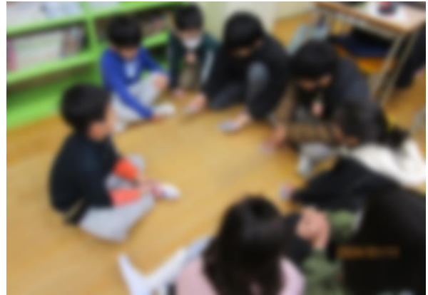
【やっとカードがそろったよ】