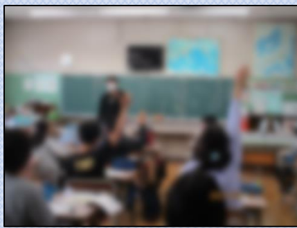
【多くの児童が挙手をしています】