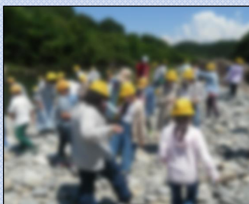
【付知川で石拾いをしました♪】