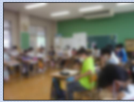
【棒引きの作戦会議中です】