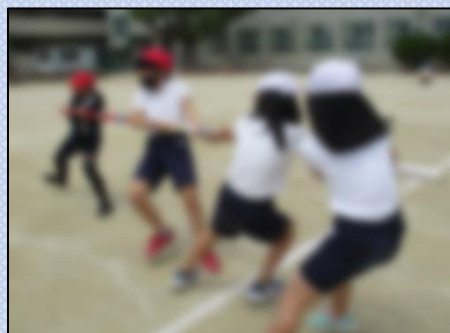
【棒を引っ張って得点にしよう】

5月22日(土)に、運動会がありました。子どもたちは、「団五(団結・挑戦・笑顔)」を目指して、運動会練習に取り組みました。当日は、これまで一緒に汗を流して練習してきた仲間たちと、一生懸命頑張ることができました。また、器具係や放送係など委員会の仕事に取り組み、高学年として頼もしく感じました。