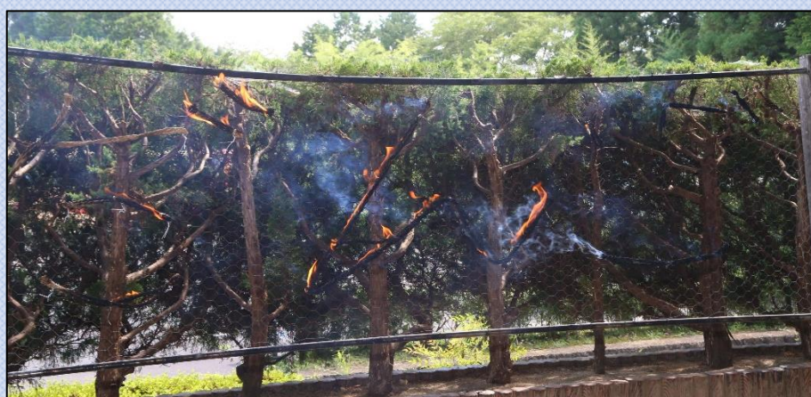
【学年目標「団五（だんご）」を火文字にしました】