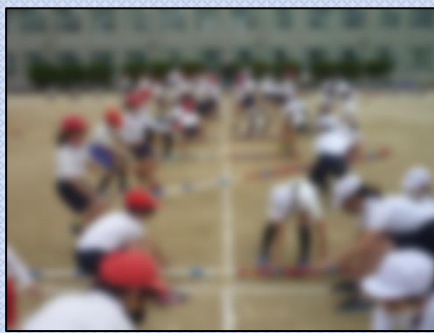
【どちらが勝つのかな?】