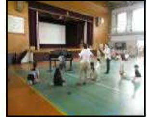
【S-1グランプリ（特技大会）オーディションの様子】