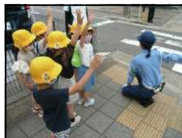
【交通安全教室の様子】