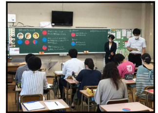
【模擬授業で検討している様子】

昭和橋小学校では、道徳の授業を中心に、ねらいにせまる場面（道徳的な判断力や心情を養う上で一番考えてほしい場面）で子どもたちが「考えたい」という「たい」(子どもの主体性)を引き出す工夫を行っています。授業を行う前に、教職員が子ども役になる模擬授業を行い、よりよい授業を目指して検討を行いました。