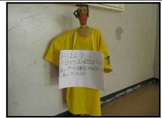
【土間に置かれた「挨拶啓発マスコット」】

感染予防のため、例年のようにPTAの皆さんや代表委員が校門に立ってあいさつ活動ができない中、代表委員の子どもたちが作成した「あいさつ週間頑張りカード」のおかげで、普段は恥ずかしくてなかなか挨拶ができない子も声を出して挨拶をする姿が見られました。