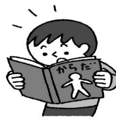
イ本について学びたいとき

保健室では、学校で起きたけがや病気の手当てをすることができます。また、相談がある時や、健康や体のことについて知りたいときにも保健室を利用することができます。利用するときは、担任の先生の許可を得て、きまりを守って利用するようにしましょう。