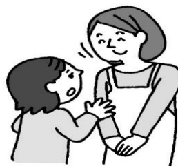
悩みや心配があるとき