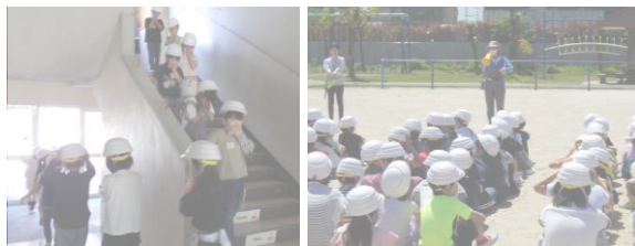
【避難する児童の様子】

4/24(木)の3限に全校で避難訓練を行いました。子どもたちは先生の指示をしっかりと聞き、落ち着いて迅速に避難場所へ移動することができました。災害はいつ起こるかわからないため、日頃からの備えが大切です。ご家庭でも「マイタイムライン」を活用し、避難のタイミングや持ち物、連絡方