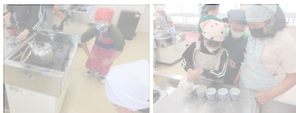
【お茶をいれる児童の様子】

5年生は、初めての調理実習としてお茶をいれる体験をしました。子どもたちは「どうやっておいしくいれるのかな?」とわくわくした表情で、手順を確認しながら丁寧に取り組んでいました。お湯の温度や茶葉の量に気を配り、友だちと協力してお茶をいれることで、家庭科の楽しさや大切