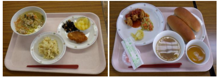
【スクールランチのメニュー】

2月14日（金）に6年生児童がスクールランチ試食会で港北中学校に行ってきました。中学校に行くのが初めての子どももいて、初めて食べるスクールランチに緊張しながらも、おいしそうに、楽しく話しながら食べる様子が見られました。スクールランチの準備や片付けの仕方を中学校の先生から教えていただき、実際の流れに沿って行うことができました。部活動や特別教室の種類など中学校生活に関する質問を中学校の先生にたくさんする様子から、中学校生活への期待の高さを感じました。残り少なくなってきた小学校生活を大事に過ごしてほしいと思います。