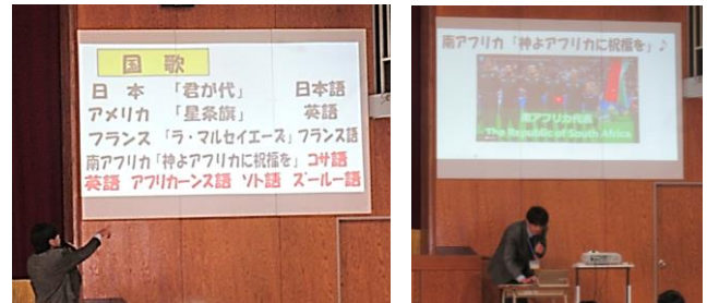
【国歌の言語を説明したり、国歌を紹介したりする様子】

そして、それぞれの民族の言葉で国歌をつくり、国民が一つにまとまるためにも、その国歌を歌っている」という話がありました。子どもたちには多様性を認め、人種差別をせず、どのような人とも同じ人類という仲間意識をもってほしいと思います。