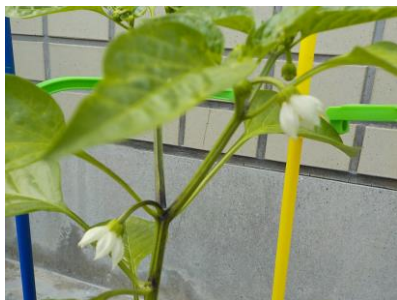
〔ピーマンの花は白い！〕

2学期以降、学校に持ってきていただかなくて結構ですので、持ち帰った植木鉢は、そのままご家庭でお使いください。