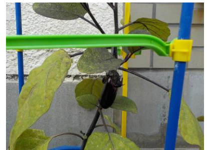
〔なすはくきも紫色！〕