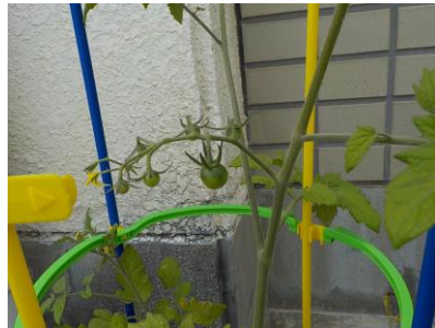
〔小さな小さな青い実！〕