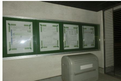
【中央土間：学習のスタンダード】