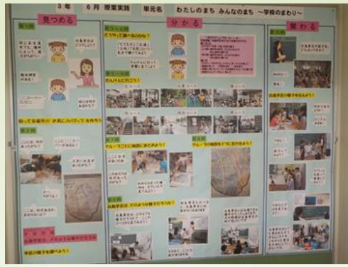
【廊下掲示：6月実践概要】