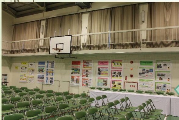
【体育館：10月単元 見どころ】