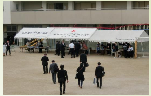
【当日の学校の様子】