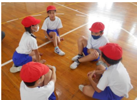
～グループで相談中～

今年度は『自分の目標に向かって挑戦する清水っ子の育成』を目指し、体育科における個別最適な学びと協働的な学びに取り組んでいます。表現運動「イメージを動きに」では、ペアやグループなど仲間との意見交流の場を大切にして、表したいイメージの動きを工夫して考えたり、誰とでも楽しそうに体を動かしたりする姿が見られました。