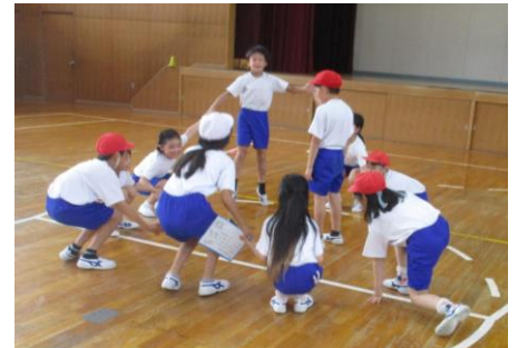
～みんな笑顔で練習中～