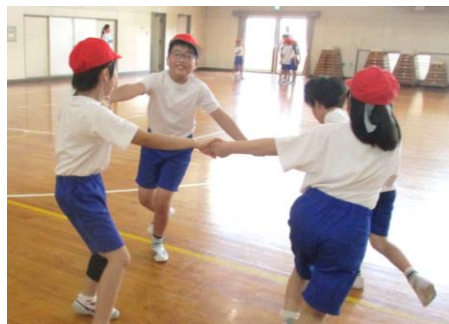
～動きを試してみよう～