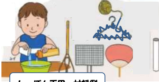
しゃぼん玉用 材料例