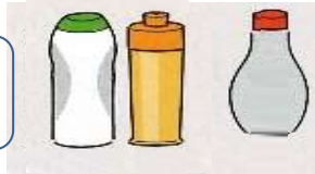
水でっぼう用 材料例

生活科「なつとなかよし」でしゃぼん玉あそび、水でっぼうあそびを7月第2週目に予定しています。左の例を参考に、材料の準備をお願いします。(うちわは紙を剥がして枠だけにして、ハンガーは毛糸を巻き付けて持たせるようにしてください。)