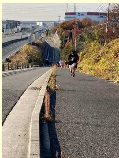
しっかり走り込みました

今年は恒例の夏季合宿が実施できなかったため 12 月に短期の冬季合宿を行いました。